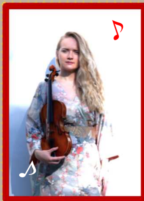
ヴァイオリン ジドレ