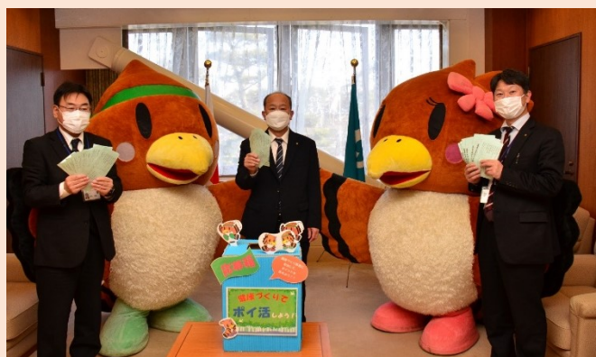
▲聖籠町役場にて抽選会を開催。町長・副町長・保健福祉課長が緑丸・花ちゃんに見守られながら、丁寧に抽選しました。

今後も多くの皆さまが、健康づくりに関心を持ち、楽しく取り組んでいただくきっかけを作りたいと思います。