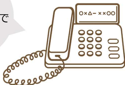
▲ 防犯機能付き電話機